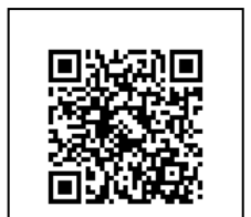
實踐課一組畢業專區