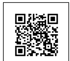
教育部數位證書驗證系統